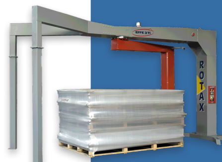
PER GRANDI PRODOTTI