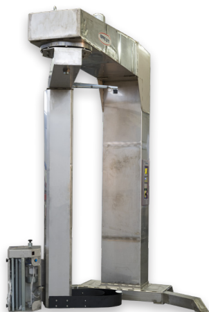
IN ACCIAIO INOSSIDABILE