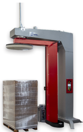
CON PRESSINO STABILIZZATORE